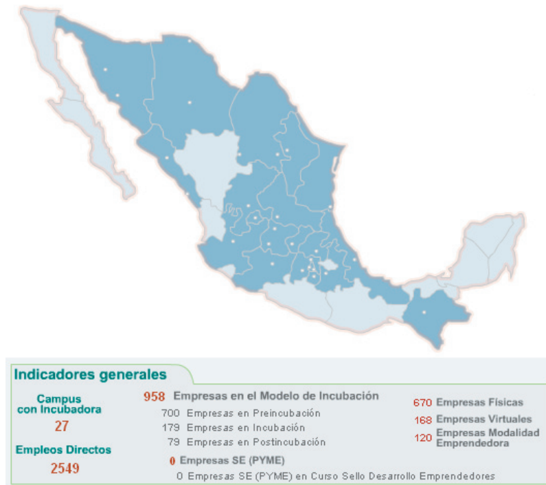
Figura 3. Indicadores generales de la red de Incubadora de Empresas

El Tecnológico de Monterrey se conforma de 33 campus distribuidos en la República Mexicana, de los cuales 29 cuentan con Incubadora de Empresas. En la Figura 3 se puede apreciar la estadística del modelo de incubación de empresas con datos al 2005.