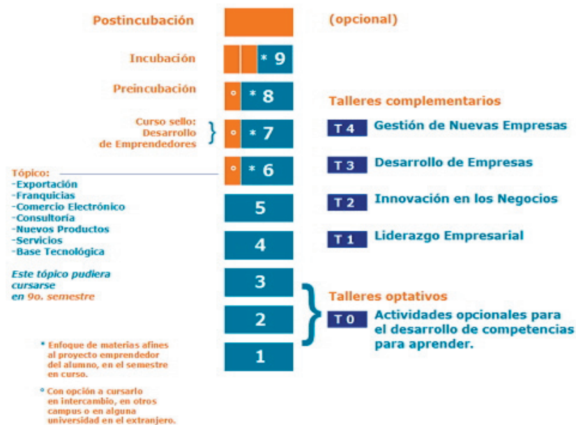
Figura 1. Plan de estudios de la modalidad emprendedora

En la Figura 1 se puede apreciar el esquema de la Modalidad Emprendedora.